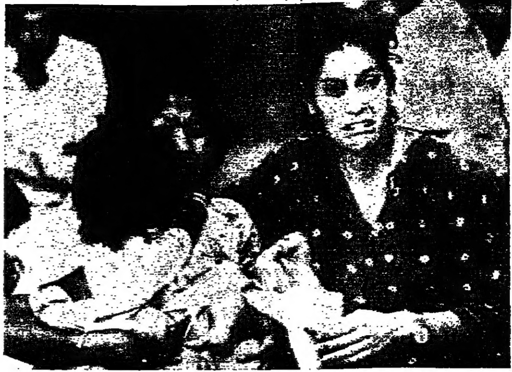
التيكامة في منطقة سقوط الطائرة اثناء نقل الاطفال الذين نجوا من الكارثة.

ويقول خبراء عسكريين ان اتساع النشاط حول المدن الساحلية ذات مخزى قليل وان التطورات المهمة عملا هي ما يجري في مناطق القرب الى سايفون.